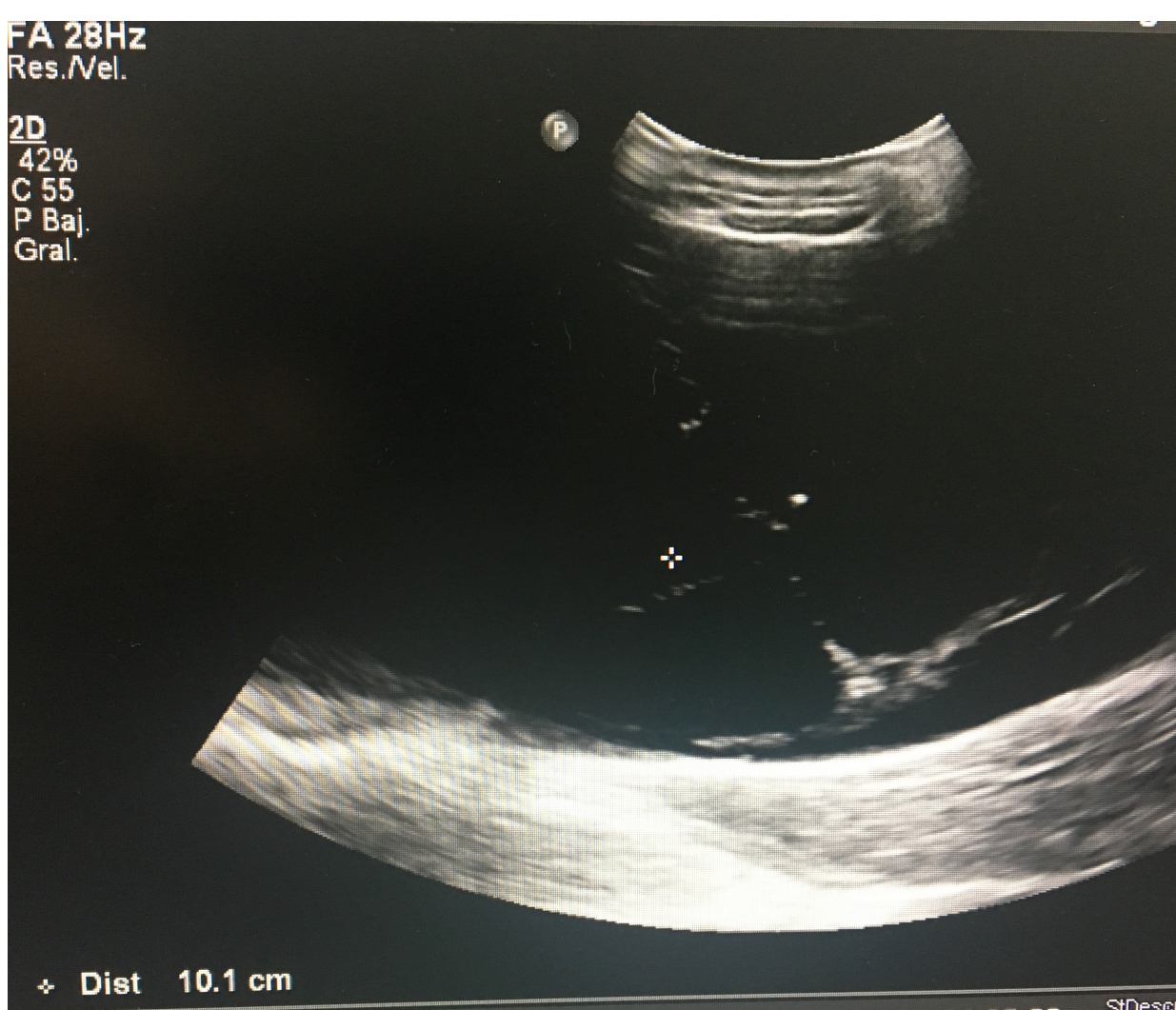
Imagen 2: Detalle de los gránulos de sulfato cálcico