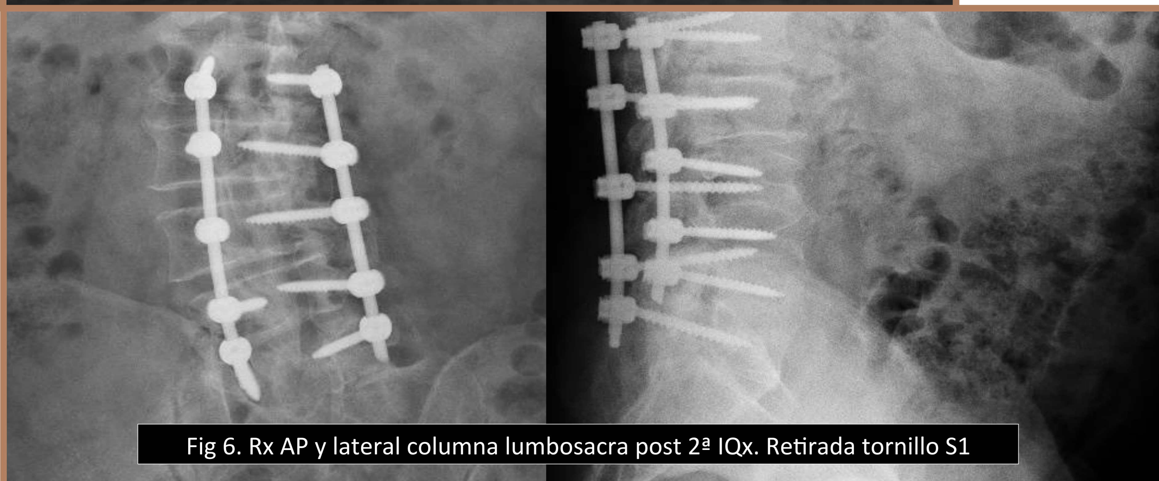
Fig 6. Rx AP y lateral columna lumbosacra post 2ª IQx. Retirada tornillo S1