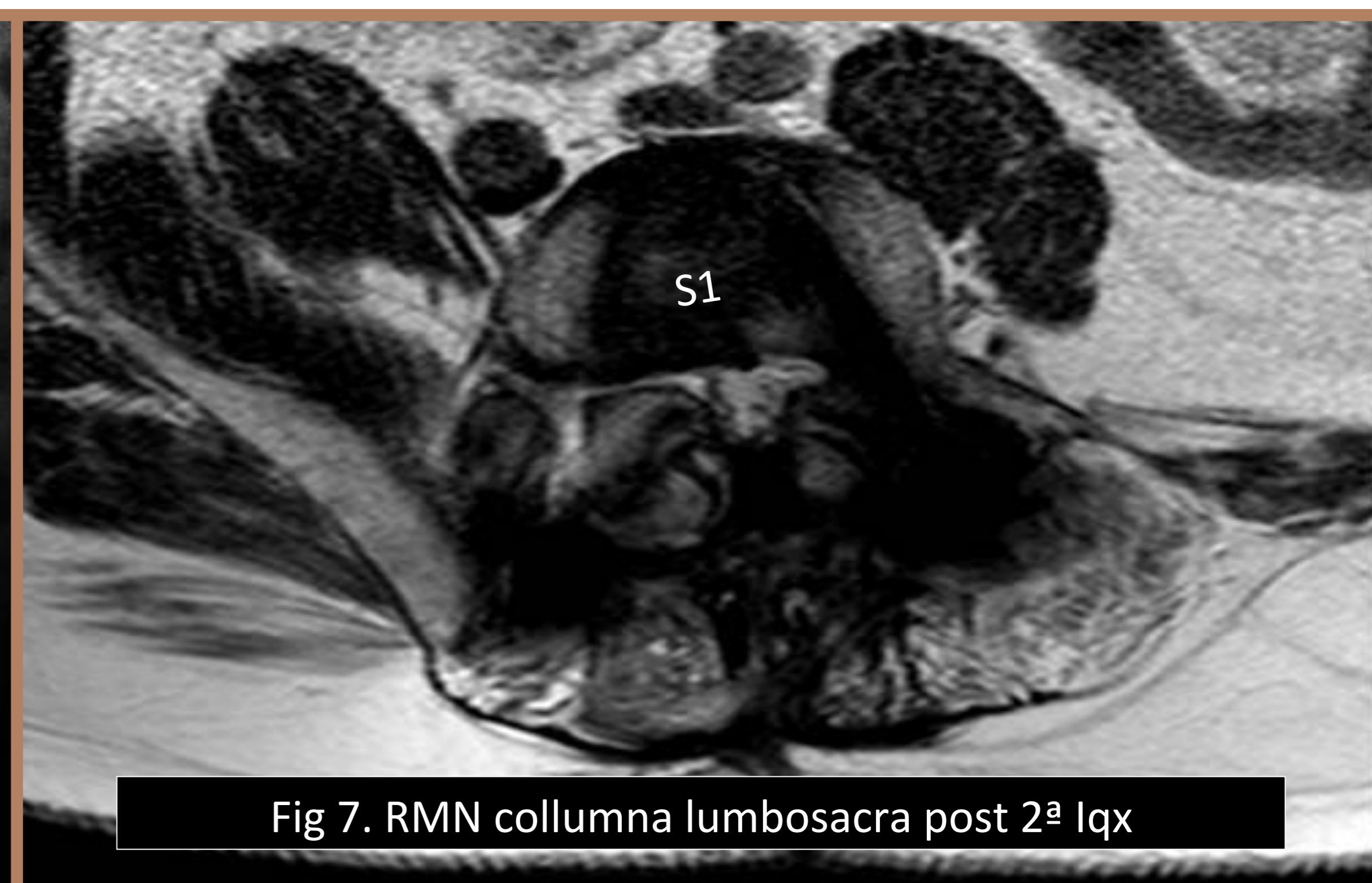
Fig 7. RMN columna lumbosacra post 2ª IQx