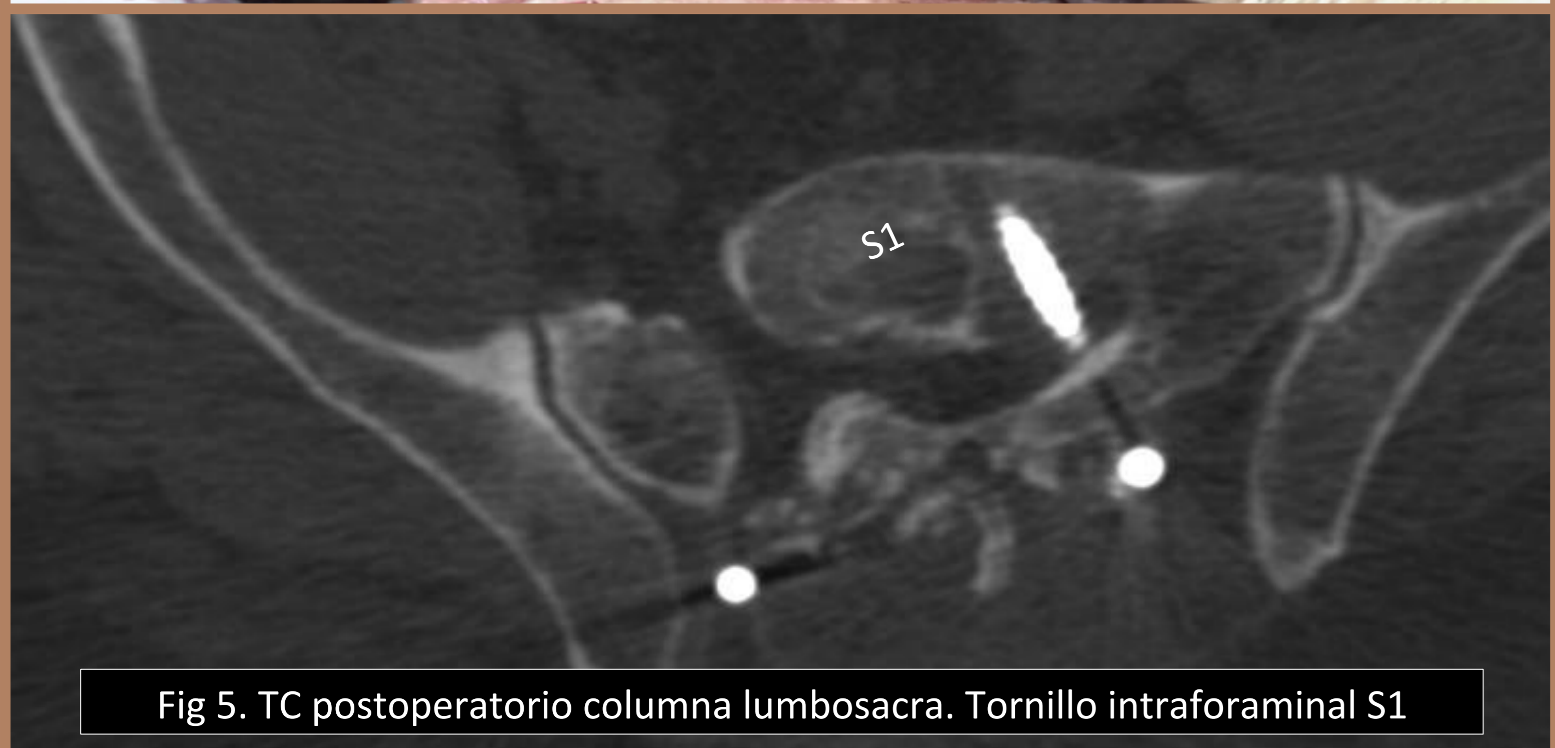
Fig 5. TC postoperatorio columna lumbosacra. Tornillo intraforaminal S1