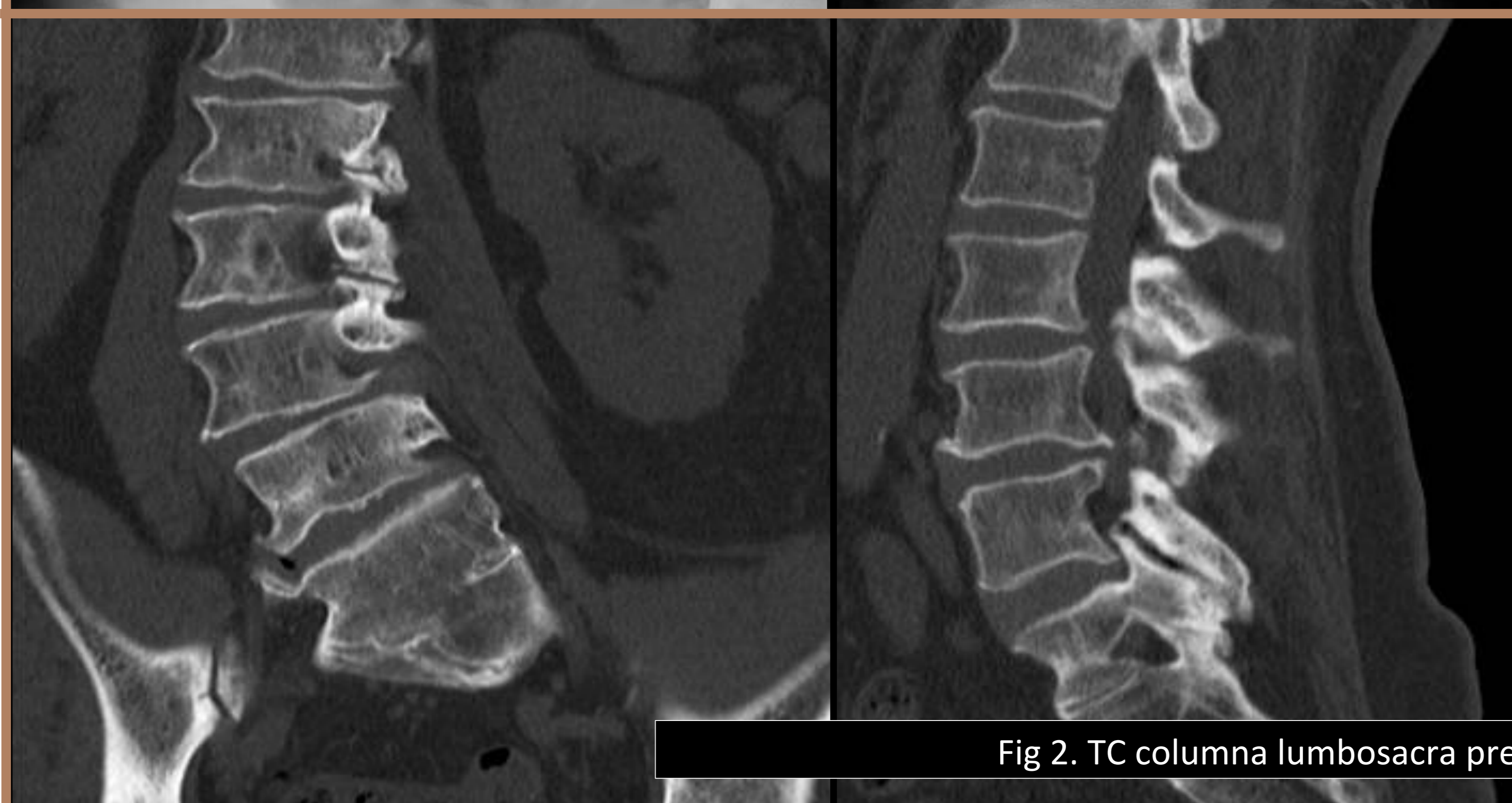
Fig 2. TC columna lumbosacra preoperatoria