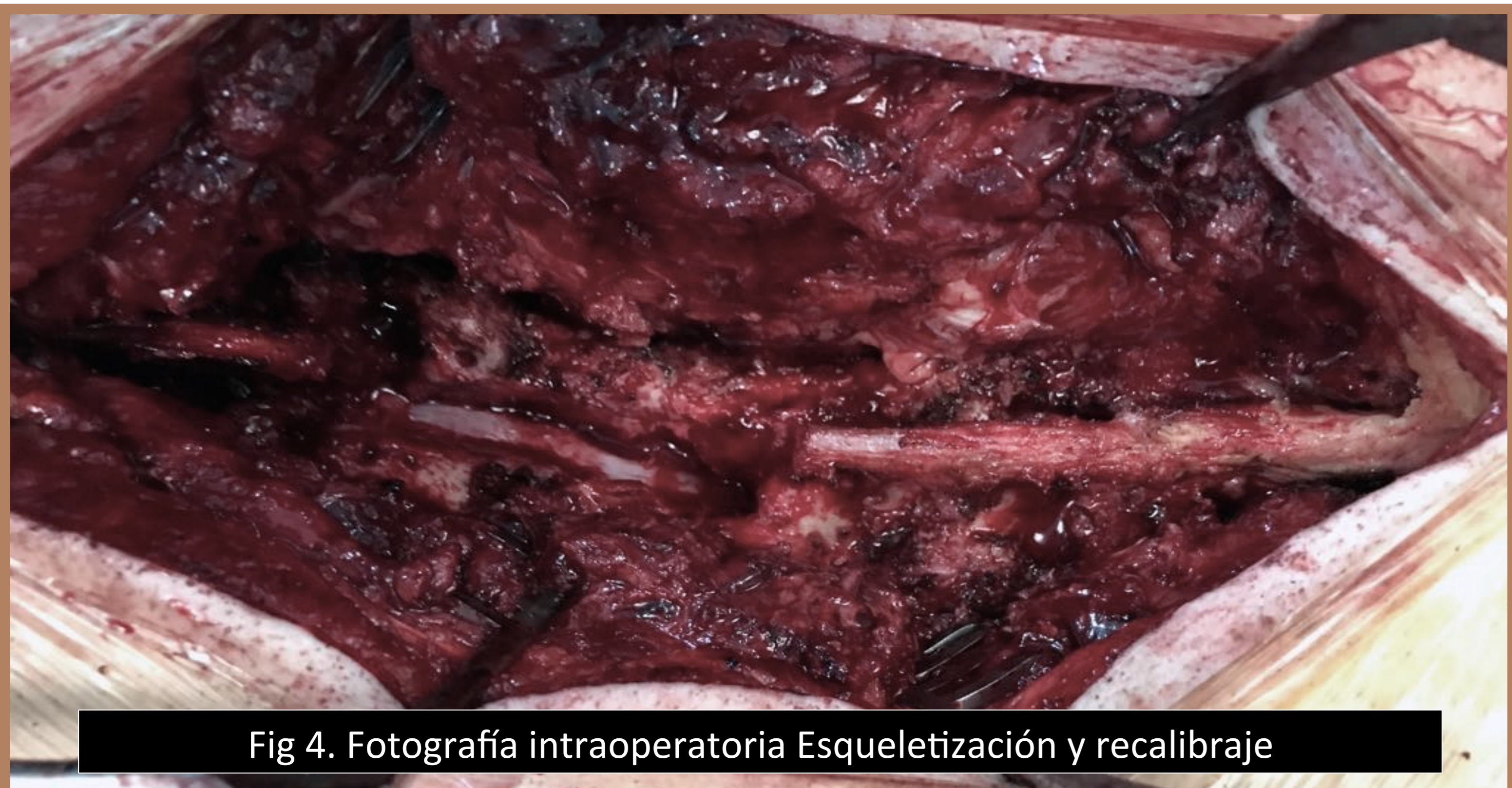
Fig 4. Fotografía intraoperatoria Esqueletización y recalibrado