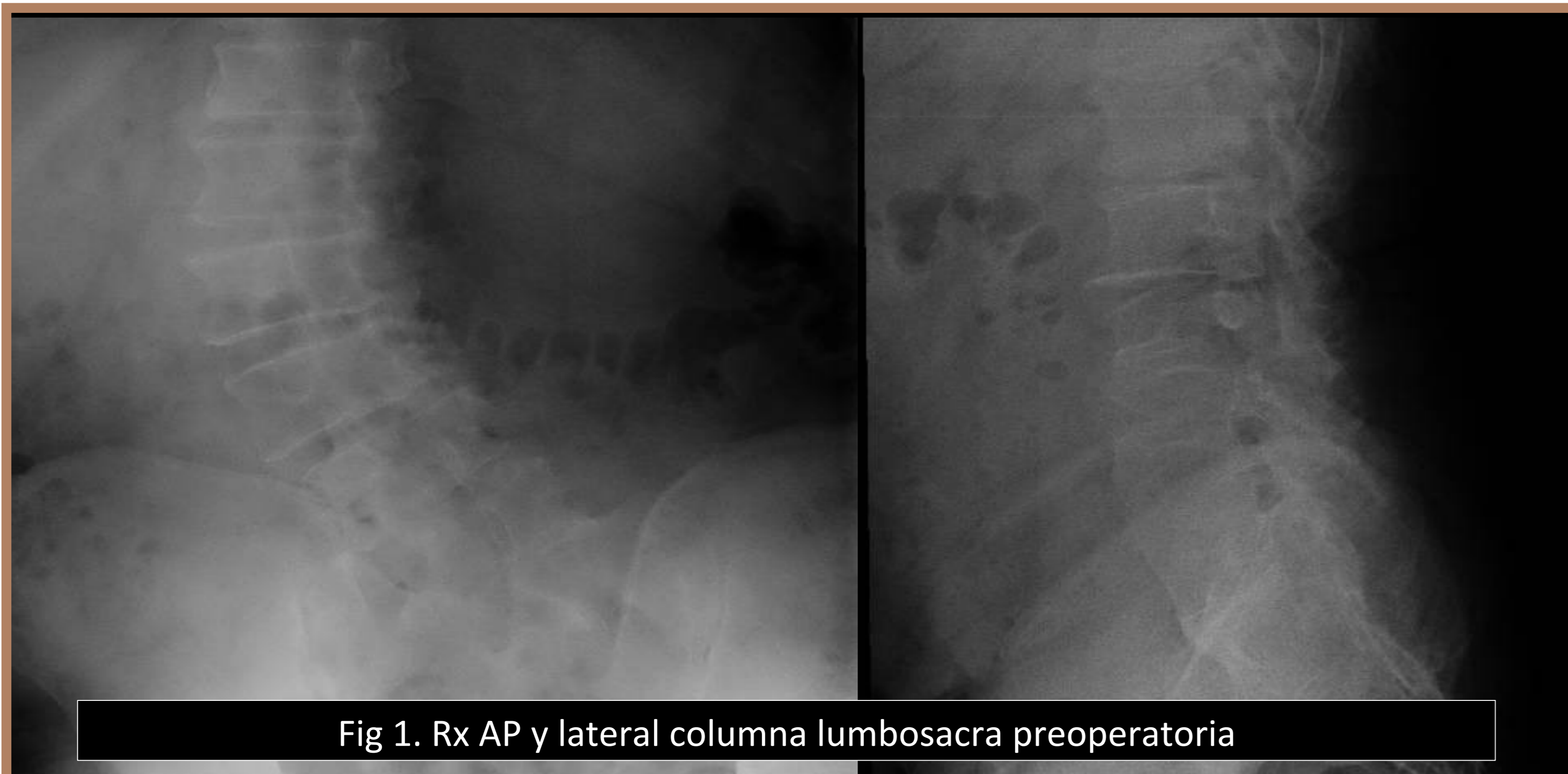
Fig 1. Rx AP y lateral columna lumbosacra preoperatoria

Se indicó cirugía (figura 4) de artrodesis posterolateral L1-S1 y recalibrage del canal lumbar con fijación in situ mediante tornillos pediculares a manos libres con control fluoroscópico, barra e injerto autólogo de cresta ilíaca.