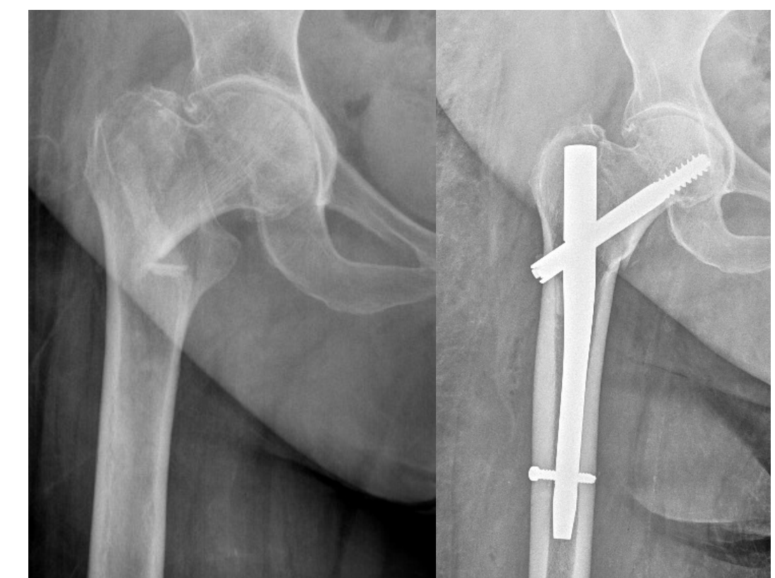
Fig. 1: radiografía anteroposterior de fémur derecho: fractura intertrocantérea tipo 31A1.2[2, 4, 9] (izquierda: imagen preoperatoria; derecha: imagen postoperatoria)