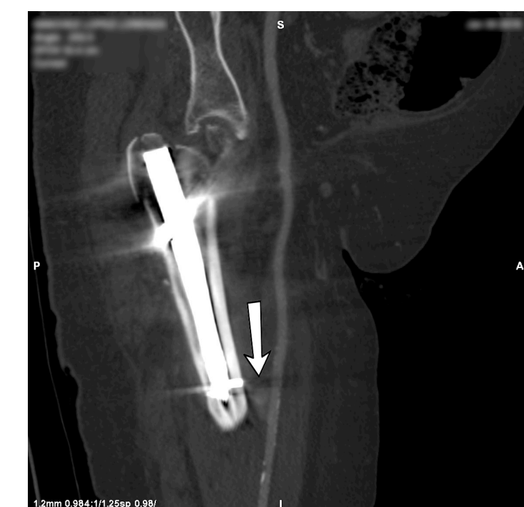
Fig. 2: pseudoaneurisma de la arteria femoral superficial (señalado con flecha)